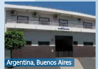
Argentina, Buenos Aires