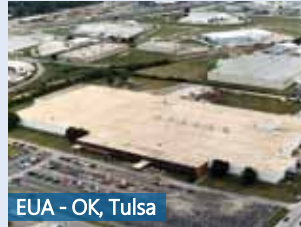
EUA - OK, Tulsa

Ruhrpumpen es una innovadora y eficiente empresa de tecnología en bombas centrífugas que ofrece a los operadores de sistemas de bombas una amplia gama de productos de calidad. Estamos comprometidos con la excelencia mundial, ofreciendo una completa gama de Bombas Centrífugas, Paquetes de Sistemas Contra incendio, Sistemas de Corte de Coque y herramientas clave para apoyar a los mercados de Petroquímica, Energía, Aplicaciones de Industria Pesada, Minería y Agua. Nuestra amplia línea de productos cumple con las más exigentes especificaciones de calidad y van más allá de los rigurosos estándares de la industria, tales como API, ANSI, Instituto Hidráulico, Underwriter's Laboratories, Factory Mutual e ISO 9001.